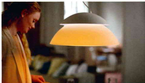
Top-Marken und Leuchten im Porträt